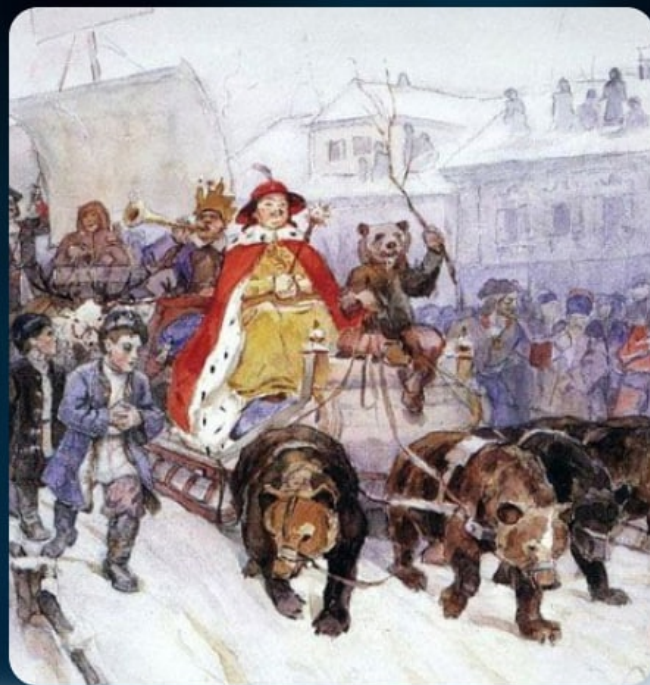
Василий Иванович Суриков. Большой маскарад в 1722 году на улицах Москвы с участием Петра I и князя-кесаря И. Ф. Ромодановского

Вскоре этот обычай пришёл и в нашу страну. В канун 1700 года Пётр I приказал перейти на летоисчисление от Рождества Христова, а заодно украшать к празднику улицы городов, расставляя у домов ёлки.