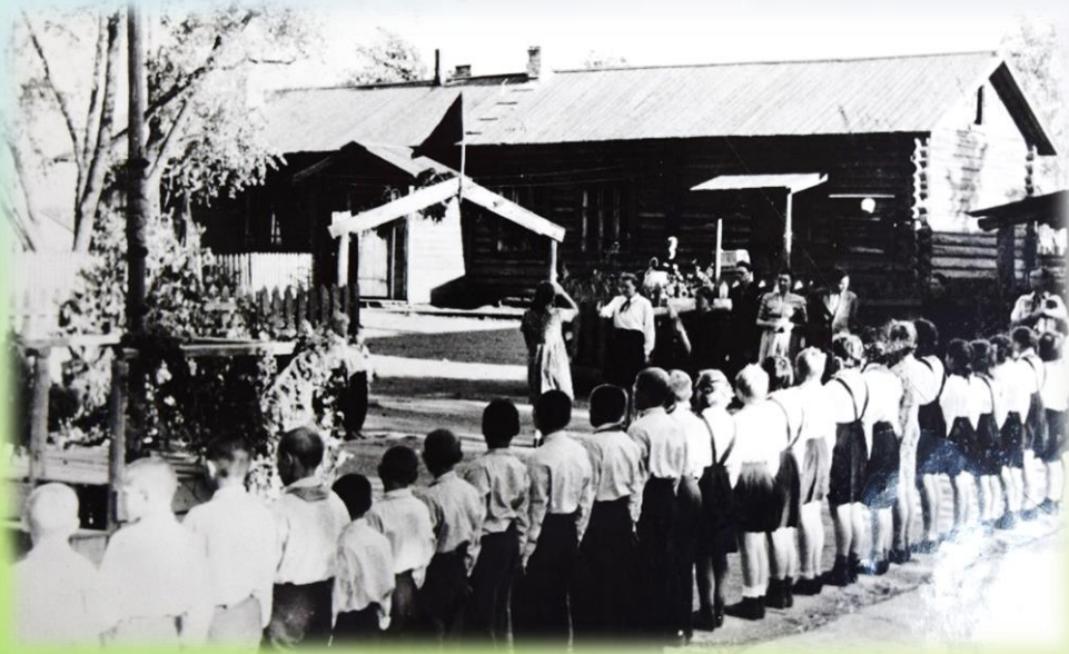
Во дворе детского дома