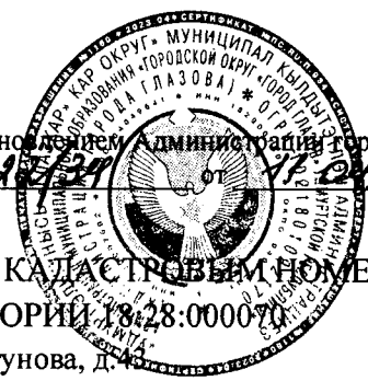
СХЕМА РАСПОЛОЖЕНИЯ ЧАСТИ ЗЕМЕЛЬНОГО УЧАСТКА С КАДАСТРОВЫМ НОМЕРОМ 18:28:000070:36 НА КАДАСТРОВОМ ПЛАНЕ ТЕРРИТОРИИ 18:28:000070

Адрес: Удмуртская Республика, г. Глазов, ул. Драгунова, д. 4 Площадь образуемой части земельного участка :36/чзу1 – 22 кв.м. Зона размещения промышленных объектов IV – V классов опасности – П2