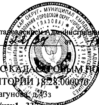
СХЕМА РАСПОЛОЖЕНИЯ ЧАСТИ ЗЕМЕЛЬНОГО УЧАСТКА С КАДАСТРОВЫМ НОМЕРОМ 18:28:000070:39 НА КАДАСТРОВом ПЛАНЕ ТЕРРИТОРИИ 18:28:000070

Адрес: Удмуртская Республика, г. Глазов, ул. Драгунова, д. 43з Площадь образуемой части земельного участка :39/чзу1 – 337 кв.м. Зона размещения промышленных объектов IV – V классов опасности – П2