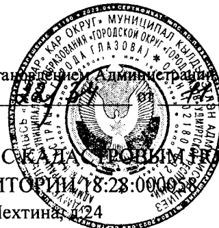
СХЕМА РАСПОЛОЖЕНИЯ ЧАСТИ ЗЕМЕЛЬНОГО УЧАСТКА С КАДАСТРОВЫМ НОМЕРОМ 18:28:000058:55 НА КАДАСТРОВОМ ПЛАНЕ ТЕРРИТОРИИ 18:28:000058

Адрес: Удмуртская Республика, г. Глазов, ул. Пехтина, д.24