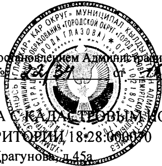
СХЕМА РАСПОЛОЖЕНИЯ ЧАСТИ ЗЕМЕЛЬНОГО УЧАСТКА С КАДАСТРОВЫМ НОМЕРОМ 18:28:000070:30 НА КАДАСТРОВЫМ ПЛАНЕ ТЕРРИТОРИИ 18:28:000070

Адрес: Удмуртская Республика, г. Глазов, ул. Драгунов, д. 45а