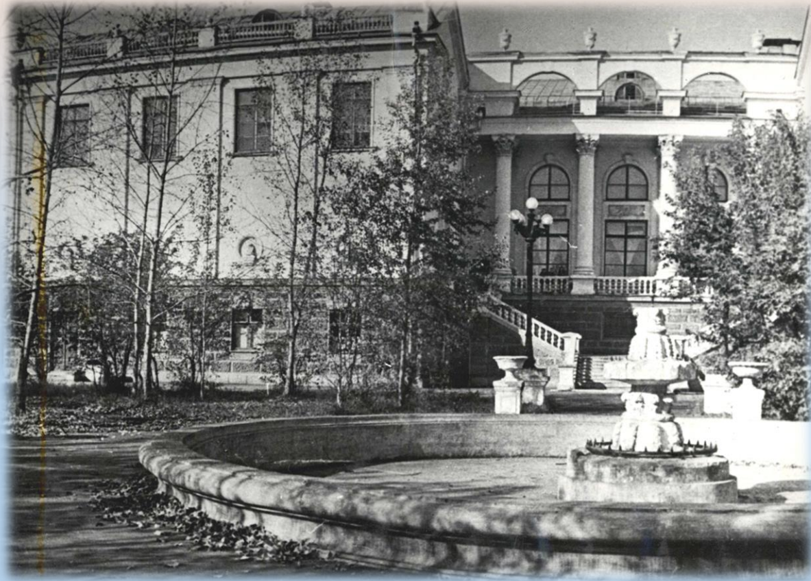
Здание дворца культуры Россия. Вид со двора. Снимок 1970 г.