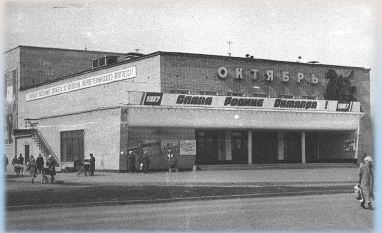
Внешний вид Дома культуры Октябрь. Снимок 17 мая 1974 г.