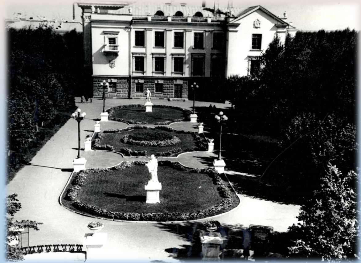
Здание дворца культуры Россия. Общий вид. Снимок 1970 г.