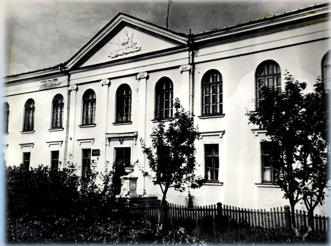
Здание детского дома культуры. Общий вид. Снимок 1970 г.