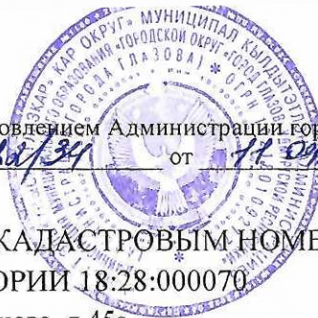
СХЕМА РАСПОЛОЖЕНИЯ ЧАСТИ ЗЕМЕЛЬНОГО УЧАСТКА С КАДАСТРОВЫМ НОМЕРОМ 18:28:000070:30 НА КАДАСТРОВОМ ПЛАНЕ ТЕРРИТОРИИ 18:28:000070

Адрес: Удмуртская Республика, г. Глазов, ул. Драгунова, д.45а