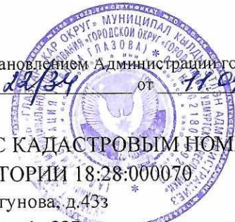
СХЕМА РАСПОЛОЖЕНИЯ ЧАСТИ ЗЕМЕЛЬНОГО УЧАСТКА С КАДАСТРОВЫМ НОМЕРОМ 18:28:000070:39 НА КАДАСТРОВЫМ ПЛАНЕ ТЕРРИТОРИИ 18:28:000070

Адрес: Удмуртская Республика, г. Глазов, ул. Драгунова, д.433