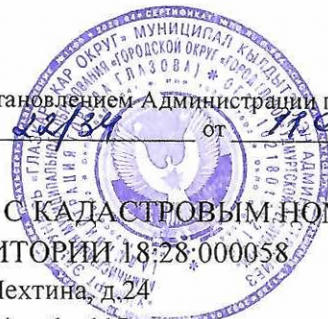
СХЕМА РАСПОЛОЖЕНИЯ ЧАСТИ ЗЕМЕЛЬНОГО УЧАСТКА С КАДАСТРОВЫМ НОМЕРОМ 18:28:000058:55 НА КАДАСТРОВОМ ПЛАНЕ ТЕРРИТОРИИ 18:28:000058

Адрес: Удмуртская Республика, г. Глазов, ул. Пехтина, д.24